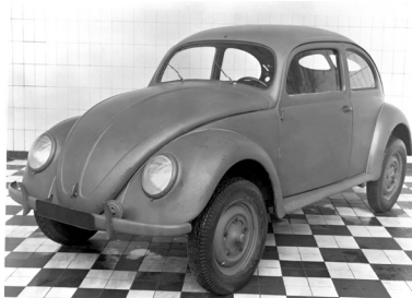
Volkswagen Typ 1, der „Käfer“

Wolfsburg - Am 27. Dezember 1945 läuft die serienmäßige Produktion der Volkswagen Limousine (Typ 1) an. Damit nimmt die eigentliche Erfolgsgeschichte des Volkswagens ihren Lauf. Ursprünglich als Prestige-Projekt der Nationalsozialisten geplant, werden statt eines Fahrzeugs für die Massen ab 1939 Rüstungsgüter produziert. Bis zum Kriegsende sind es nur 630 Einheiten des 1938 in KdF-Wagen umbenannten Modells, die das Volkswagenwerk verlassen. Erst unter britischer Treuhänderschaft, dank der strategischen Weitsicht von Major Ivan Hirst, beginnt in Wolfsburg die einmalige Erfolgsgeschichte des VW Käfer.