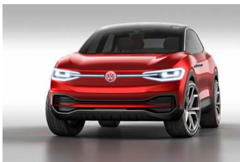
Der neue I.D.CROZZ

Wolfsburg/Frankfurt (D) – Der Countdown für den Durchbruch der Elektromobilität läuft und das Jahr 2020 könnte den Umschwung bringen. Denn die Marke Volkswagen forciert mit der Entwicklung einer neuen Generation innovativer Elektrofahrzeuge – I.D. 2 , I.D. BUZZ 3 und I.D.CROZZ – diese Zeitenwende. Dr. Herbert Diess, Vorstandsvorsitzender der Marke Volkswagen Pkw, sagte anlässlich der Volkswagen Group Night: „Die Marke Volkswagen investiert in den kommenden fünf Jahren sechs Milliarden Euro in die E-Mobilität. Unsere Aufgabe ist es, moderne Technik für viele Menschen verfügbar zu machen. Das gilt erst recht in Zeiten des technologischen Umbruchs. Eines ist klar: Der Golf der Zukunft muss wieder ein Volkswagen sein!“