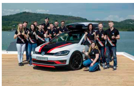
Premiere 2: Golf Variant TGI GMOTION aus Zwickau mit den Auszubildenden von Volkswagen Sachsen

Die Golf-Unikate entstanden innerhalb von knapp neun Monaten und nach den Ideen der 29 Auszubildenden aus 12 Berufen. Bei der Gestaltung von Exterieur und Interieur brachten die jungen Frauen und Männer viel handwerkliches Geschick ein, nutzten digitale Entwicklungs- und Fertigungsmethoden wie CAD-Konstruktion und 3D-Drucktechnik, zudem programmierten sie eigene Applikationen für die Steuerung spezieller Fahrzeugfunktionen via Smartphone oder Tablet-PC.